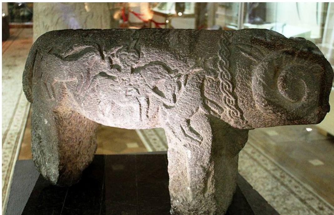
Каменное изваяние барана из Нахичевани, относящаяся к XVI веку. Хранится в Музее истории Азербайджана.

На территории Азербайджана и всего Закавказья найдено немало каменных надгробных изваяний баранов, созданных этническими предками современных азербайджанцев – тюрками огузами. В народе эти изваяния называют «Daş qoç» («каменные бараны» - азерб.).