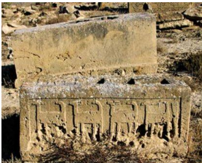
Изображения верблюдов на надгробном камне с кладбища Софии Хамид вблизи Баку.

На мемориальных памятниках Азербайджана встречаются и изображения верблюдов. Имеется также скульптурное изображение верблюда в святилище Софи Хамид недалеко от Баку. Верблюдов издревле разводили и использовали в хозяйственных целях в Азербайджане. Верблюд – одно из самых почитаемых животных в зороастрийской религии, бытовавшей в Азербайджане до распространения Ислама. Само имя основателя религии пророка Заратуштры (Зороастра) переводится как «обладающий верблюдом» [4].